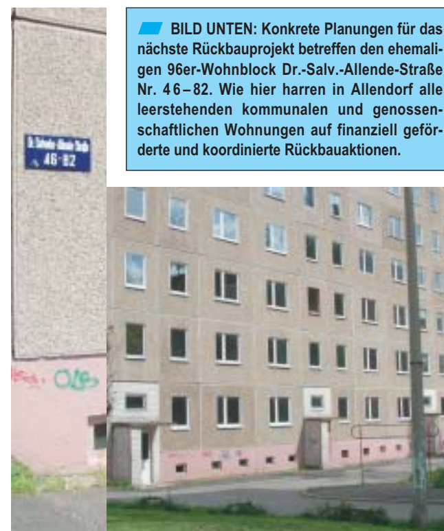
BILD UNTEN: Konkrete Planungen für das nächste Rückbauprojekt betreffen den ehemaligen 96er-Wohnblock Dr.-Salv.-Allende-Straße Nr. 46–82. Wie hier harren in Allendorf alle leerstehenden kommunalen und genossenschaftlichen Wohnungen auf finanziell geförderte und koordinierte Rückbauaktionen.