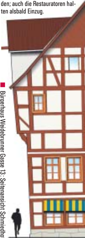
■ Bürgerhaus Weidebrunner Gasse 13: Seitenansicht Schmiedhof

■ Weidebrunner Gasse 13 – Haus des Kunsthandwerks: Im Jahr 2006 wurden zur Erhaltung des historisch wertvollen Gebäudes aus dem 14. Jh. entscheidende Schritte unternommen. Dessen Planungsentwurf fand bei den Entscheidungsgremien Zustimmung, und wir hoffen auf Umsetzung im kommenden Jahr. Unlängst, im November, erreichte uns endlich die Bestätigung der Förderbehörde. Nun kann mit der Demontage der neuzeitlichen Einbauten begonnen werden; auch die Restauratoren halten alsbald Einzug.