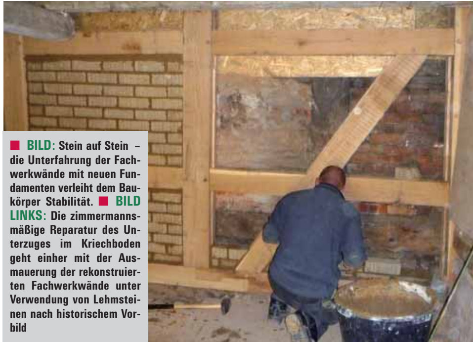
■ BILD: Stein auf Stein – die Unterfahrung der Fachwerkwände mit neuen Fundamenten verleiht dem Baukörper Stabilität. ■ BILD LINKS: Die zimmermannsmäßige Reparatur des Unterzuges im Kriechboden geht einher mit der Ausmauerung der rekonstruierten Fachwerkwände unter Verwendung von Lehmsteinen nach historischem Vorbild