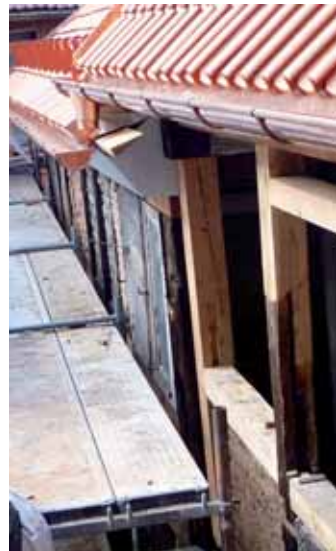
■ BILD: Blick auf den sanierten Traufpunkt des Nebengebäudes ■ RECHTS: freigelegtes Kreissegment eines Frischfeuers mit kompakter Schlacke / Holzkohle inkl. Sohle und Kühlwassergerinne ■ LINKS: ein schon fertiggestelltes Bauprojekt von Bießmann & Büttner – die Pension Kirchhof 15 als neuer Glanzpunkt der Stadt