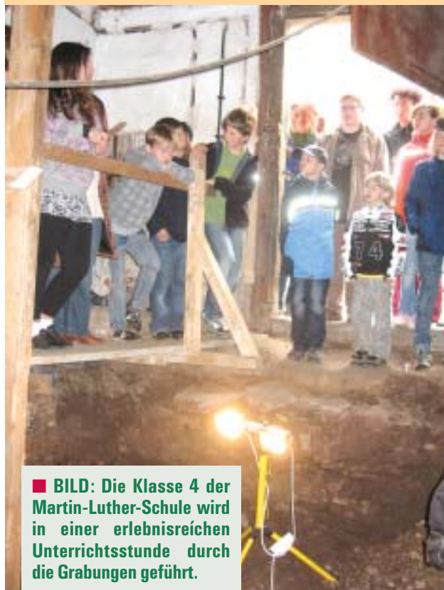
■ BILD: Die Klasse 4 der Martin-Luther-Schule wird in einer erlebnisreichen Unterrichtsstunde durch die Grabungen geführt.

■ BILDER OBEN LINKS + RECHTS: Ministerpräsidentin Christine Lieberknecht im Gespräch über die Grabungsergebnisse auf dem Grundstück Weidebrunner Gasse 13 mit Archäologin Martina Reps und Uwe Eberlein von der Wohnungsbau-gesellschaft (Mitte); rechts stehend mit Bürgermeister Thomas Kaminski auf den Grundmauern des »überdimensionalen Profanbaus« im Bereich des heutigen Innenhofs.