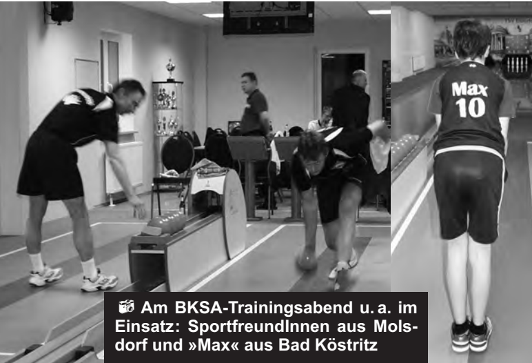
Am BKSA-Trainingsabend u. a. im Einsatz: SportfreundInnen aus Molsdorf und »Max« aus Bad Köstritz