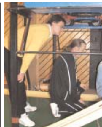
Erinnerungen an das perfekt geführte Schiedsrichterseminar im Sportzentrum »Poinger Einkehr«.

anschl. Siegerehrungen und Schlussfeier in der Eissporthalle »Steel Arena Kosice«