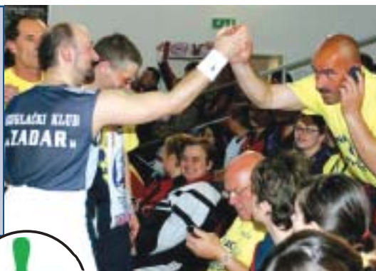
CHL-Siegerposen via Internet aus Podbresova mit der Kamera eines Schlachtenbummlers. Aufn.: (4)

STATISTIK. ■ Champions League 2007 Damen. ■ Um Platz 3 in Podbresova (SVK). CS Elektromures Romgaz Targu Mures (ROM) – KK Brest Cerknica (SLO) 5:3 MaP / 11,0:13,0 SaP | 3296:3255 Kegel (Barabas – Pavlovic 0:1 MaP / 553:587 Kegel, Martina / Medesan – Gornik 0:1 / 558:587, Muntean – Zaloznik 1:0 / 554:544, Baci – Ugrin 1:0 / 586:507, Duka – Kranjc 1:0 / 535:513, Ban / Hategan – Ule / Potokar 0:1 MaP / 510:517 Kegel = 3:3 + 2:0 MaP). ■ Champions League 2007 Herren. ■ Um Platz 3 in Podbresova (SVK). SKV Rot-Weiß Zerbst 1999 (GER) – Ferroep Szeged TE (HUN) 7:1 MaP / 13,5:10,5 SaP | 3573:3499 Kegel (Cech – Kovacs 1:0 MaP / 595:592 Kegel, Reiser – Kakuk 1:0 / 611:574, Volkland – Zapletan 0:1 / 564:575, Gerdau – Karsai 1:0 / 594:590, Hoffmann – Kiss 1:0 / 596:587, Fuckar – Földesi 1:0 MaP / 613:581 Kegel = 5:1 + 2:0 MaP). ■ Champions League 2007 Damen. ■ Halbfinale. SKK Podravka Koprivnica (CRO) – CS Elektromures Romgaz Targu Mures (ROM) 5:3 MaP / 14,5:9,5 SaP | 3334:3242 Kegel (Orehovec 623 – Baci 563). SKC Victoria 1947 Bamberg (GER) – KK Brest Cerknica (SLO) 5:3 MaP / 12,5:11,5 SaP | 3283:3256 Kegel (Kicker 567 – Pavlovic 602). ■ Champions League 2007 Herren. ■ Halbfinale. KK Konikom Osijek (CRO) – Ferroep Szeged TE (HUN) 7:1 MaP / 14,5:9,5 SaP | 3601:3456 Kegel (Branislav Bogdanovic 651 – Kakuk 604). KK Zadar (CRO) – SKV Rot-Weiß Zerbst 1999 (GER) 5:3 MaP / 11,5:12,5 SaP | 3569:3546 Kegel (Ukalovic 637 – Cech 637)