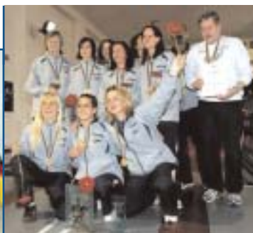
KK Zadar (CRO) | SKC Victoria Bamberg (GER)