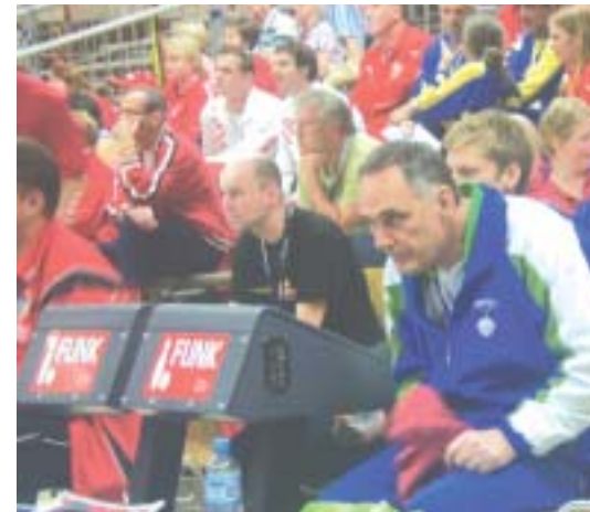
III. Kegel-Weltmeisterschaften | Teams Damen + Herren in Dettenheim (Baden):