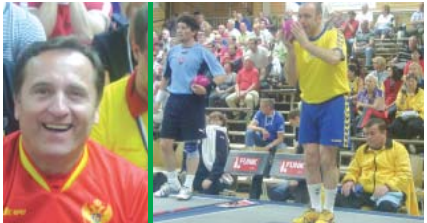
III. Kegel-Weltmeisterschaften | Teams Damen + Herren in Dettenheim (Baden):