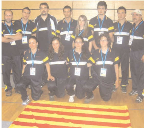
XV. Kegel-WM U 23 | Team weiblich:

IMPRESSUM | Herausgeber: Sektion Ninepin Bowling Classic (NBC) in der World Ninepin Bowling Association (WNBA) | Sitz: Neubaugasse 26 / 3 / 47 · A-1070 Wien | Redaktion: Rolf Thieme (timetext) & Klaus Barth (krivan) | Herstellung inkl. Satz + Layout: viademica.verlag.berlin, Tieckstraße 8, 10115 Berlin · Telefon +49 (0) 335.414.59.16 + Telefax 0335.414.59.23 · eMail über info@viademica.de | V.i.S.d.P.: Klaus Barth, Leipziger Straße 46, 10117 Berlin · Telefon +49 (0) 30.20.16.57.21 + Fax (0721) 15143.72.59 · eMail: medien.barth@fiqwnbanbc.org · NBC-Website: www.fiqwnbanbc.org mit allen Informationen über diese Weltmeisterschaften sowie über den internationalen Kegelsport